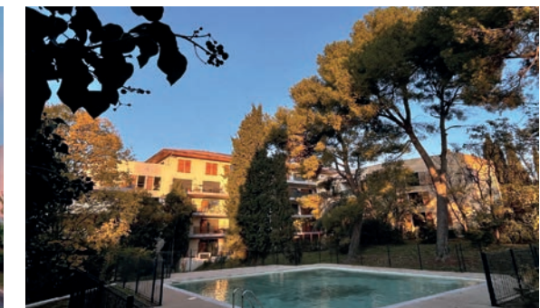
Aixcellence - Aix-en-Provence