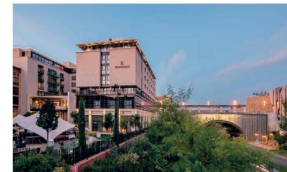
HÔTEL RENAISSANCE - Aix-en-Provence