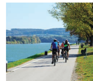
Balade à vélo sur les voies douces