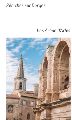
Les Arènes d'Arles