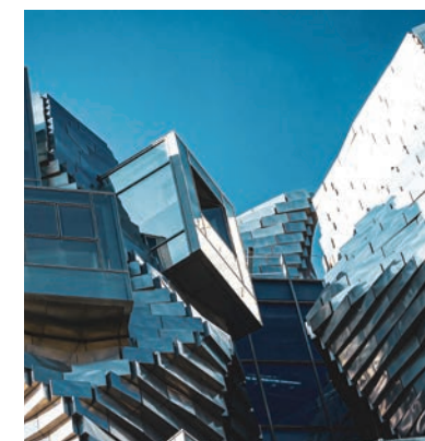
Luma - Arles

C'est là, que Quai des Arts vous offre de vivre l'exception arlésienne.