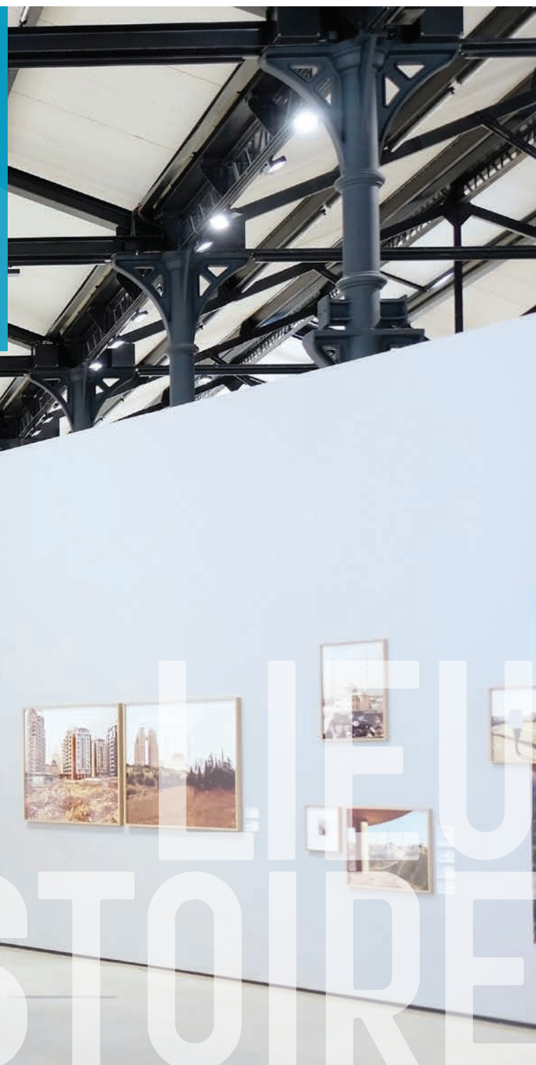
Les Rencontres de la photographie d'Arles

Outre ses beautés romaines comme son amphithéâtre et ses créations futuristes comme le Luma, la cité est aussi avec les rencontres de la photographie un haut lieu de l'art et du savoir vivre . Avec la Camargue à ses portes elle s'approche de la mer pour vivre la grande tradition taurine dont flamants roses et chevaux blancs en sont les apparats.