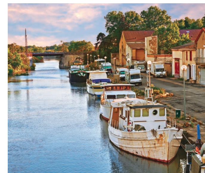
Péniches sur Berges