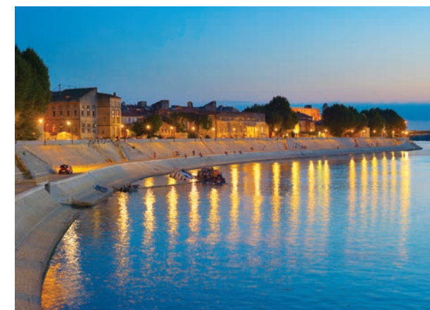
Les Quais d'Arles