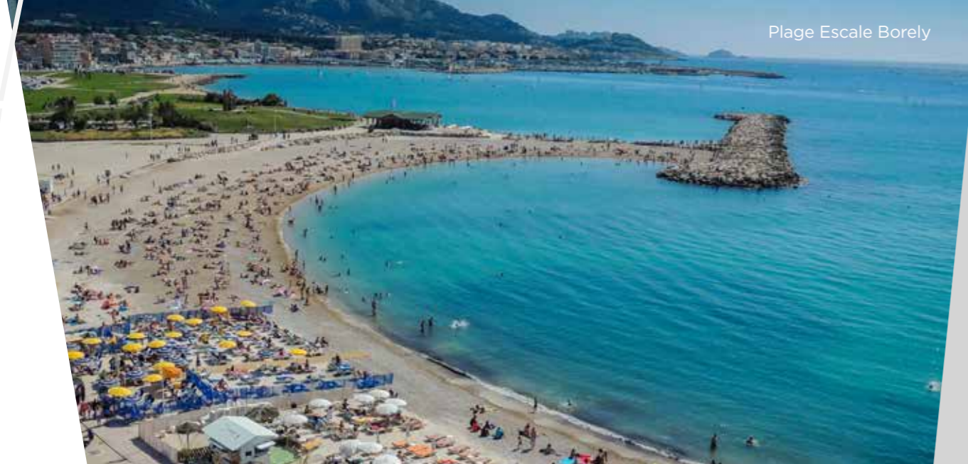
Plage Escale Borely